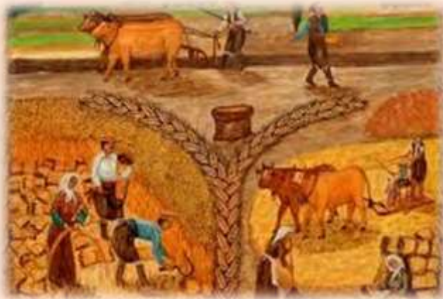
Έργο της Ανδρούλλας Κτωρή

Όλες τις οι ζωγραφιές αποτελούν μνήμες από την κατεχόμενη Ακανθού όπως τη θυμάται από την παιδική της ηλικία. Ο Τηλέμαχος Κάνθος λέει στην πρώτη ατομική της έκθεση: «Η ζωγραφική της Ανδρούλλας Κτωρή είναι αυτοτελής με ζεστό χρώμα». Η ίδια λέει πως το γεγονός ότι αναγκάστηκε να αφήσει πίσω της την Ακανθού το 1974 επηρέασε ολόκληρη τη ζωή της. Όλα της τα θέματα βασίζονται στις γειτονιές και σε αγαπημένους τόπους του χωριού της.