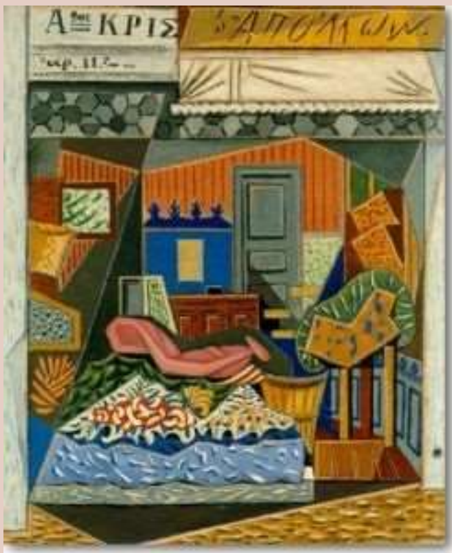
1 η Φάση (Αναλυτικός κυβισμός) Τίτλος: Οπωροπωλείον Απόλλων, 1935