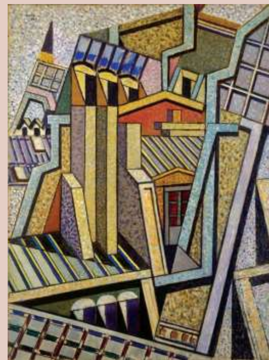
3 η Φάση (γεωμετρικές συνθέσεις) Τίτλος: Παρισινές στέγες, 1954